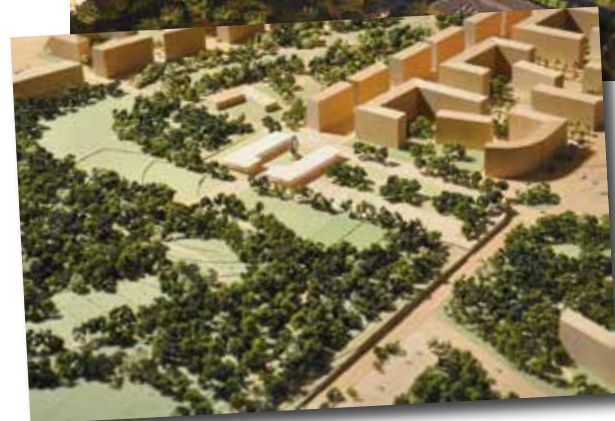
Il rendering della Piazza della Promenade. Sopra quello con la vista dall'alto del parco e della zona residenziale

ne "Leed ND" (che prevede elevati standard di sostenibilità) a livello di area urbana e non di singolo edificio. Oltre al grande parco urbano , cuore del progetto e le cui dimensioni (circa 390mila metri quadrati) lo porteranno a essere tra i più grandi parchi di Milano, la proposta prevede nuove importanti funzioni pubbliche di interesse non solo locale quali: l' arena polifunzionale coperta che, con la sua capienza di